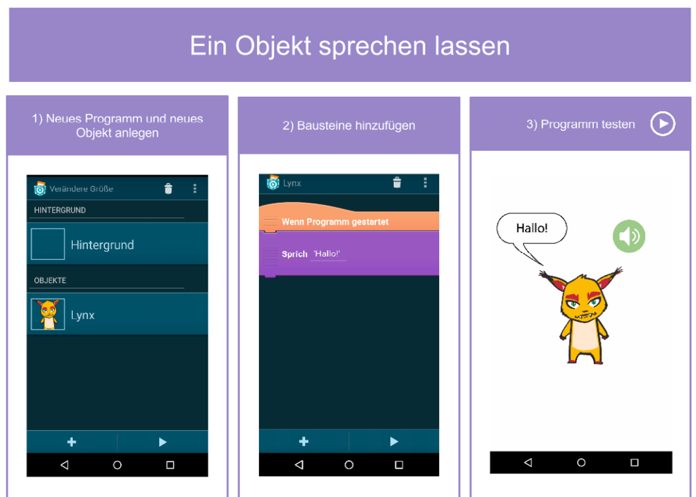
Abbildung 2: Pocket Karte

Der freie Online-Kurs wurde über einen Zeitraum von sechs Wochen durchgeführt, mit knapp 700 Teilnehmenden unterschiedlicher Altersgruppen. In jeder Woche gab es zumindest ein Video mit theoretischem Inhalt und Begleitmaterial (siehe Abb. 2), das die grundlegenden Funktionen sowie Tipps